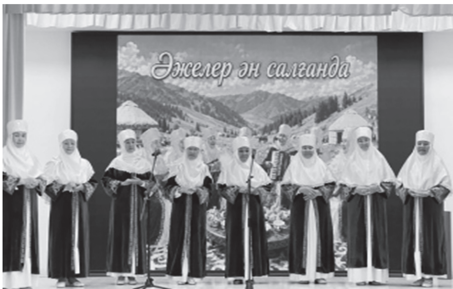
Уге және музыкалық күйемелдеу жұмысын үйлестіруге атсалысып келеді.