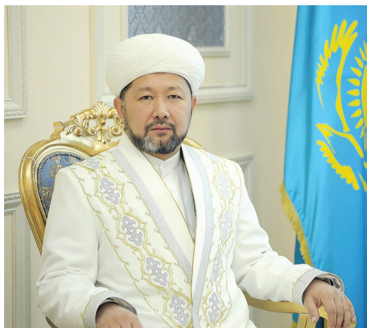
Наурызбай қажы ТАҒАНҰЛЫ, Қазақстан Мұсылмандары діни басқармасының төрағасы: